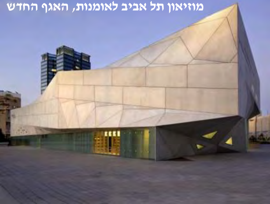
מוזיאון תל אביב לאומנות, האגף החדש